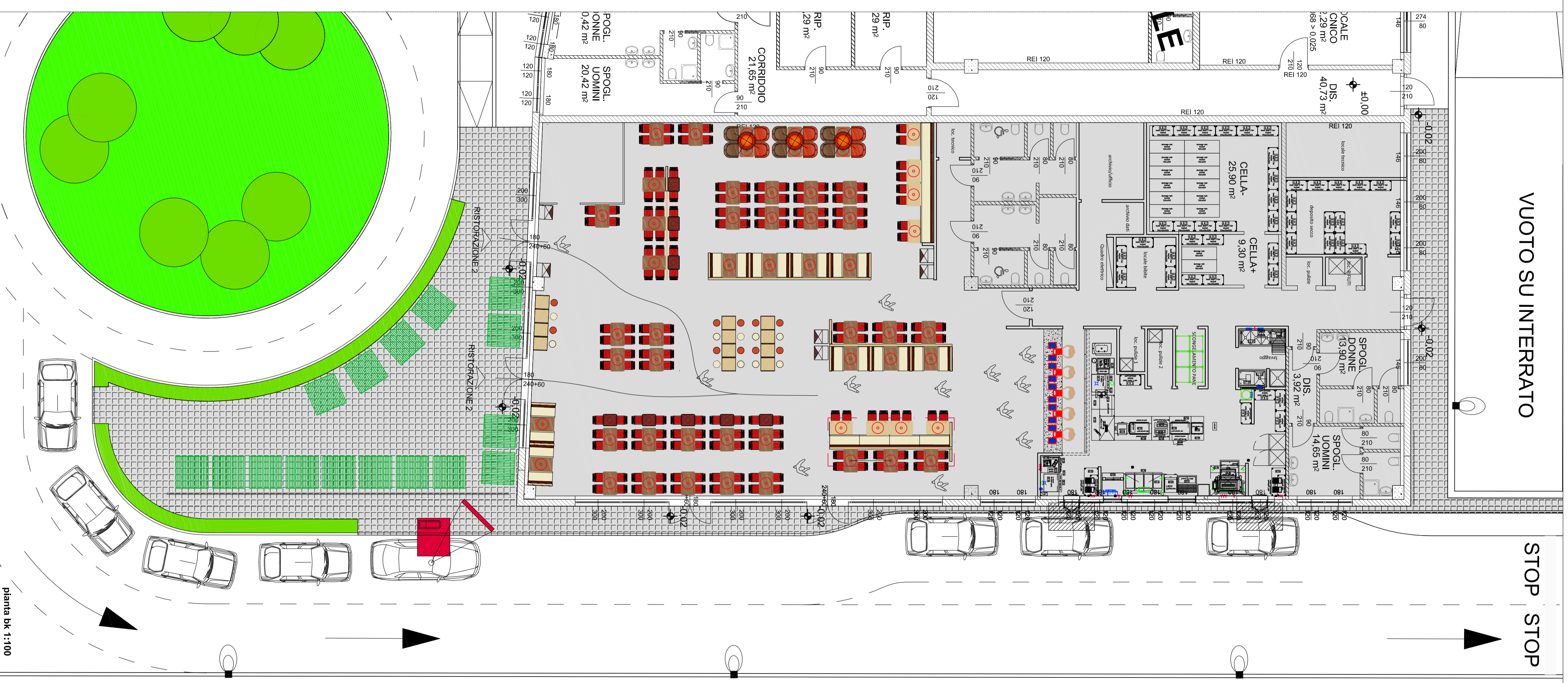
piano Bk 1:100

VERIFICA FATTABILITÀ POSTI TAVOLA INTERNI: 252 PL POSTI TAVOLA ESTERNI: 64 PL (con tavolo 1x1+10cm) SUPERFICIE METÀ INTERNA: 611 mq